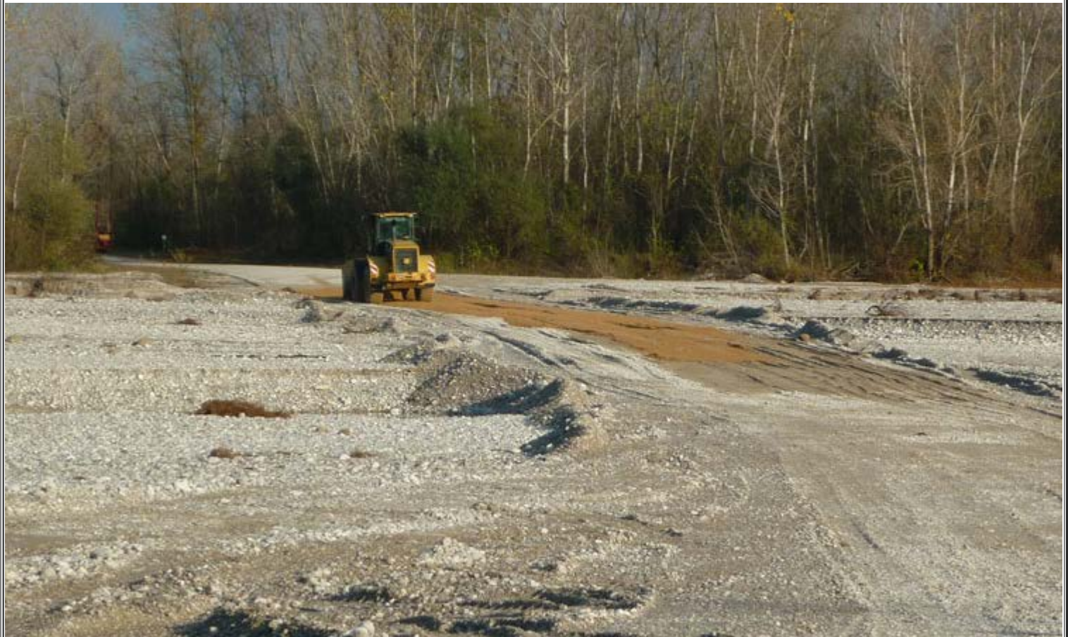
Guado a breve distanza dalla Chiesa