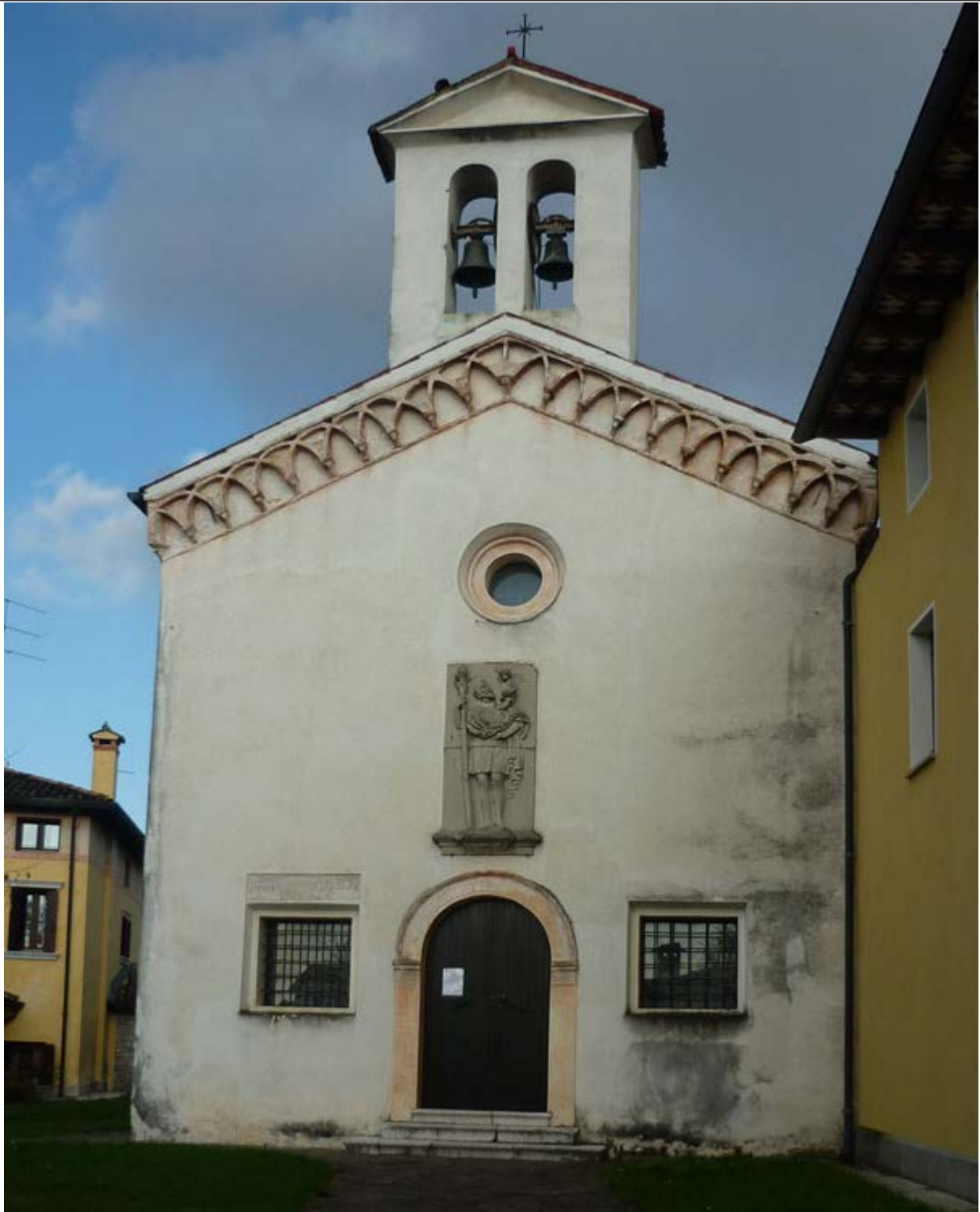
facciata della chiesa con raffigurazione di san Cristoforo