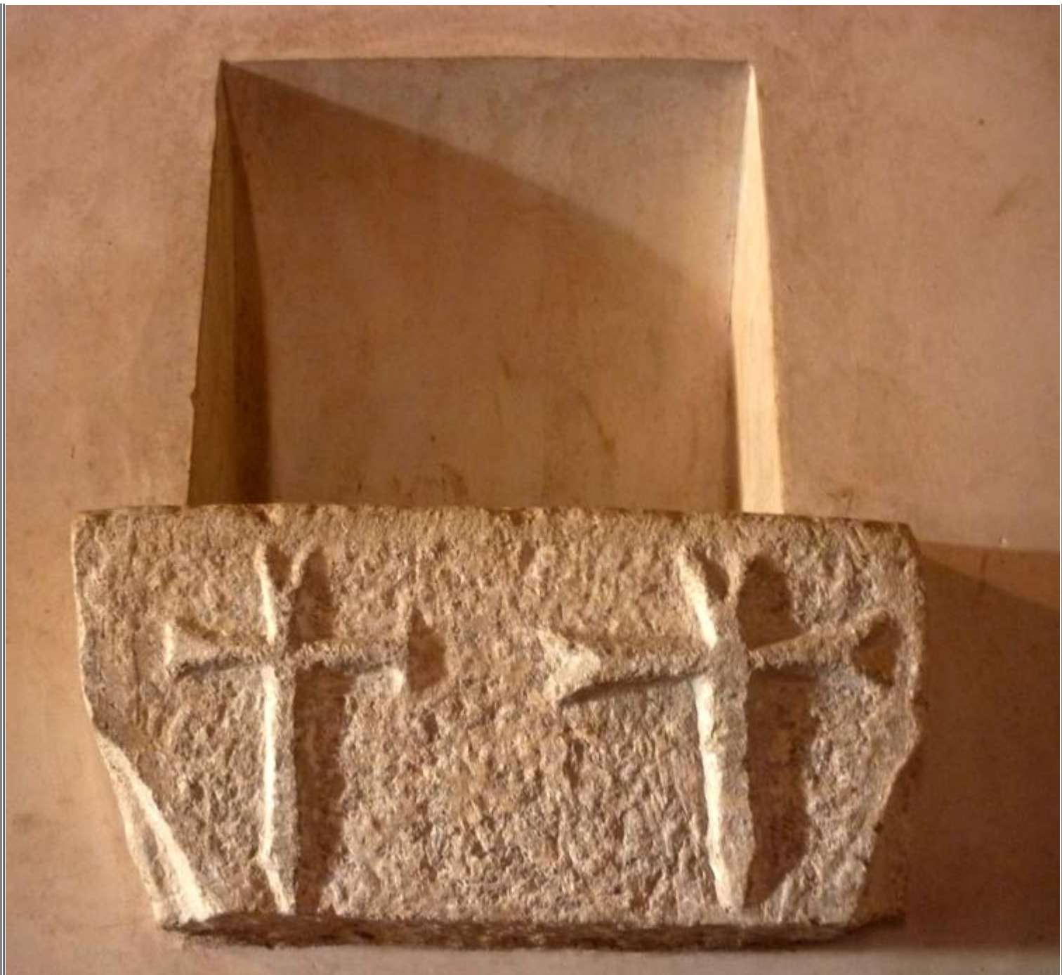
Acquasantiera in granito con le croci di Santiago